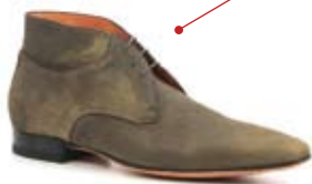
Тъмнокафяви обувки Santoni Suede