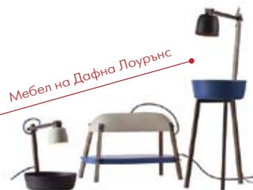
Мебел на Дафна Лоурънс