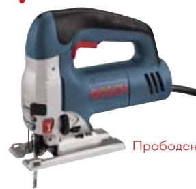
Прободен трион на Bosch