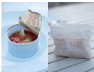
Вкусна морска храна на брега