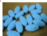
Zopiclone - „Обичам да спя, много интензивно, поне 8 часа, след това началото на деня е като нов живот“