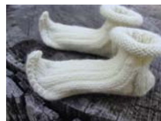
Класически топли чорапи