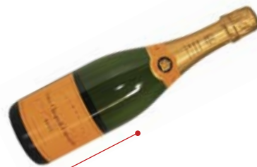
Veuve Clicquot, жълт етикет