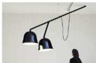
Двойна лампа lumiere poire на братя Бурулек