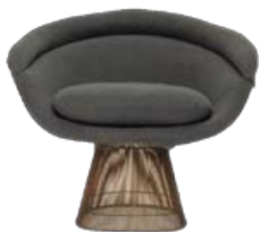
Rare Pair Copper Lounge Chairs на Уорън Платнър