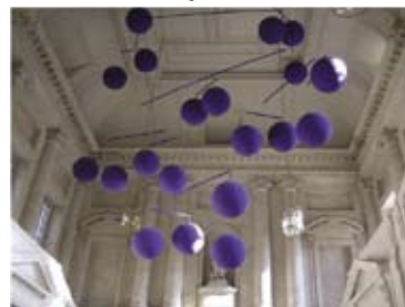
Лампи на Ксавие Вейлан