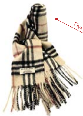
Пухкав вълнен шал