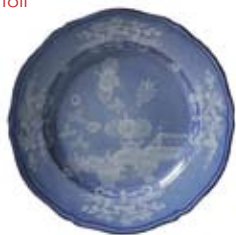
Чинии на Richard Ginori Oriente Italiano