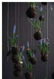
Цветя във въздуха! String Gardens на Федор ван дер Валк