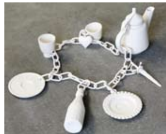
Декоративен аксесоар за маса Lucky Charm на Demakersvan