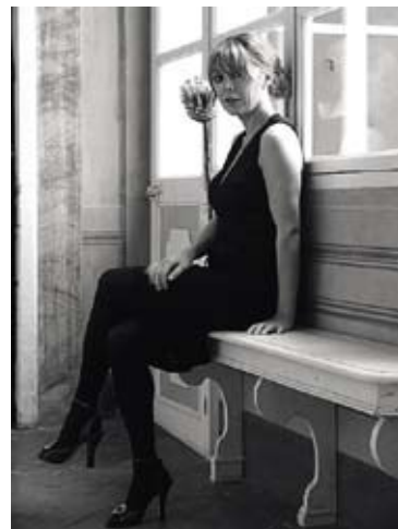
АРХ. САБРИНА БИНЯМИ, b-arch studio