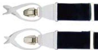
Тиранти Hein Strijker