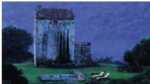
Малко бягство за почивка в Корсика, във вила на Domaine de Murtoli