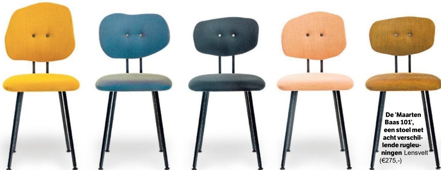
De 'Maarten Baas 101', een stoel met acht verschillende rugleuningen Lensvelt (€275,-)

Leijh verbaast zich over de vele gezochte ontwerpen om hem heen. „Ik heb dit vak gekozen om problemen op te lossen, om dingen beter of comfortabeler te maken.” Toen hij een rondje door Lambrate maakte, be kroop hem het gevoel, „dat velen maar wat doen”.